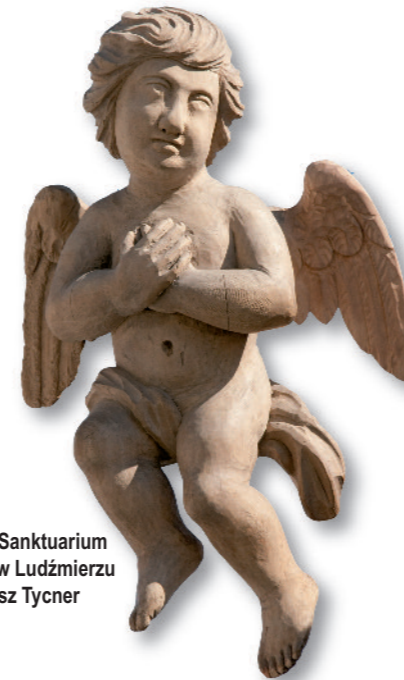
Aniołek, Sanktuarium Maryjne w Ludźmierzu

Artysta urodził się w Gliczarowie i tu spędził swoje życie. Nie tylko rzeźbił (w drewnie, metalu i kamieniu), ale był też świetnym muzykantom i tancerzem. To dlatego mówi się o nim „Leonardo da Vinci z Gliczarowa”. Jednym z jego najbardziej znanych dzieł są trzy ołtarze w „Starym Kościółku” przy ulicy Kościeliskiej w Zakopanem, czy krzyż nad Czarnym Stawem.